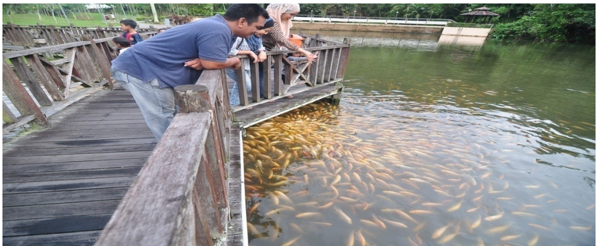
Taman Jubli Bukit Aup