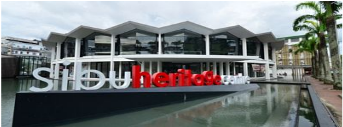
Sibu Culture Heritage Mini Museum