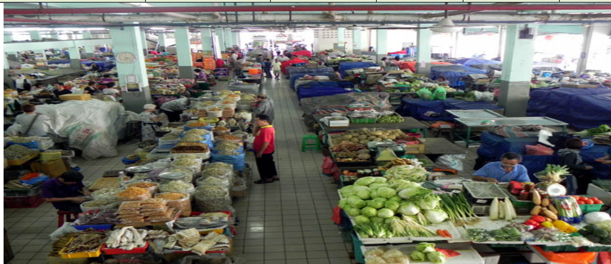
Sumber : Jabatan Pertanian Bahagian SibU