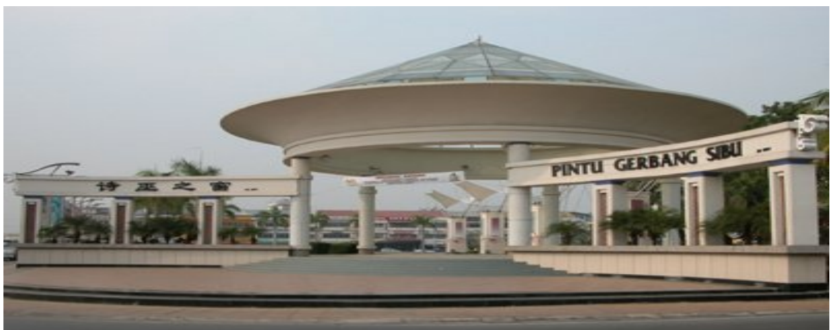
Pintu Gerbang SibU